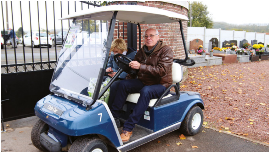
Une voiturette au service des aînés et des personnes à mobilité réduite était proposée à la Toussaint au sein du cimetière. Ainsi, il leur était plus facile de se rendre sur la tombe de leurs défunts et de transporter leurs fleurs.