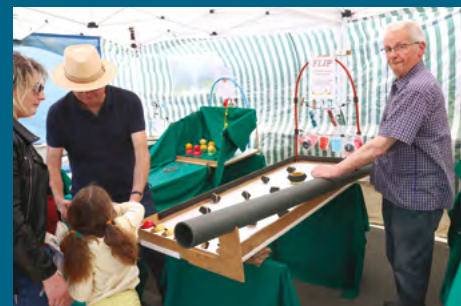
Samedi 3 juin, village associatif et concert Horizon.