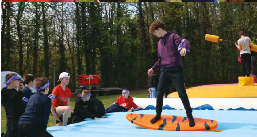
Participation des jeunes à une rencontre INTERVILLES au parc de la Lawe lors des vacances d'avril.