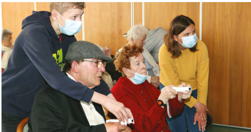
Visite des ados de l'espace jeunes à la RÉSIDENCE Henri-Hermant pour une initiation aux jeux sur la Wii.