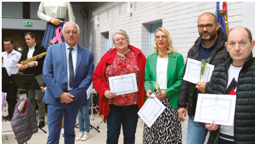
Cérémonie du 1 er mai, remise des diplômes de la médaille du travail aux Divionnais.